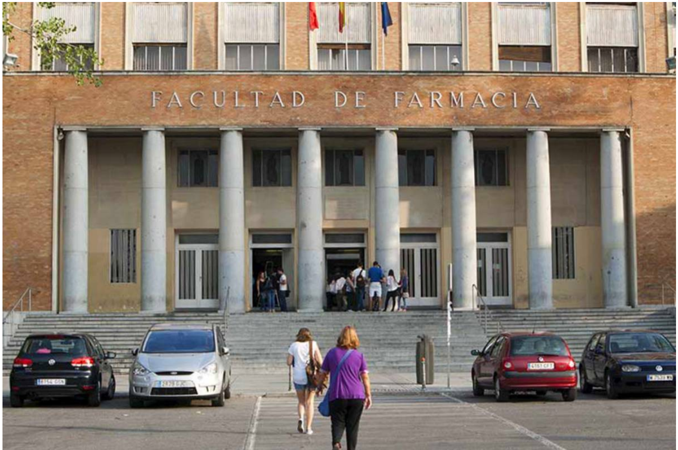
Facultad de Farmacia de la Universidad Complutense de Madrid (UCM)/UCM.

Regístrate gratis en Diario Médico . Para seguir leyendo Diario Médico necesitamos saber tu perfil profesional . Así podremos garantizarte que estás dentro de un portal para profesionales relacionados con la Salud. Sólo te llevará dos minutos de tu tiempo y tendrás acceso a la mejor información sanitaria en castellano y a todos nuestros servicios premium. A partir de hoy no te pediremos más datos y sólo tendrás que acceder con tu email y contraseña.